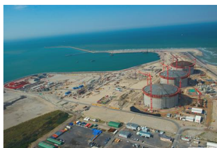
Terminal méthanier – DUNKERQUE