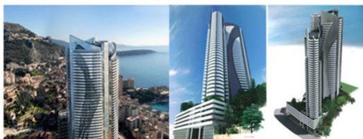
Tour odéon - MONACO